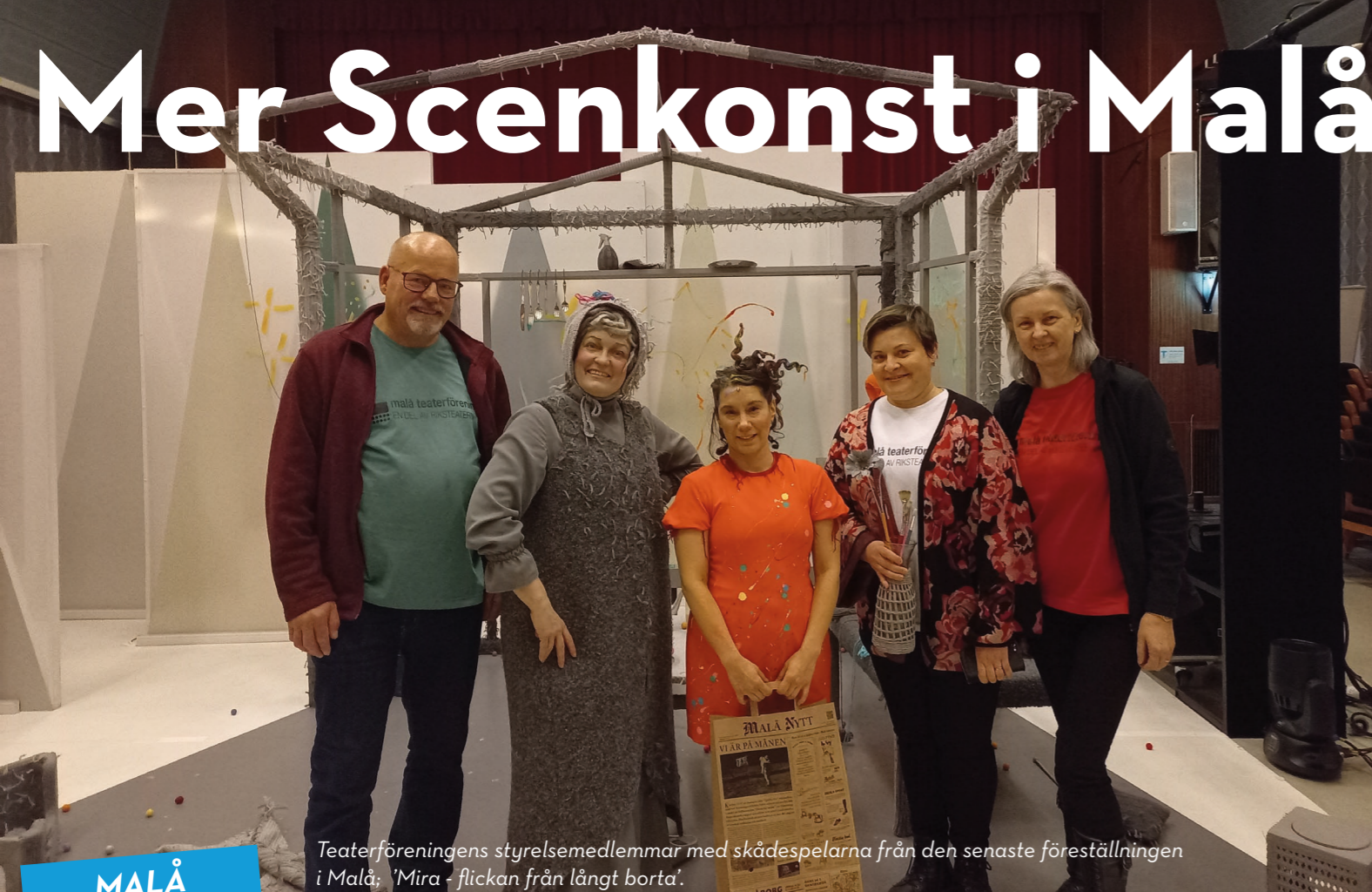
Teaterföreningens styrelsemedlemmar med skådespelarna från den senaste föreställningen i Malå; 'Mira - flickan från långt borta'.