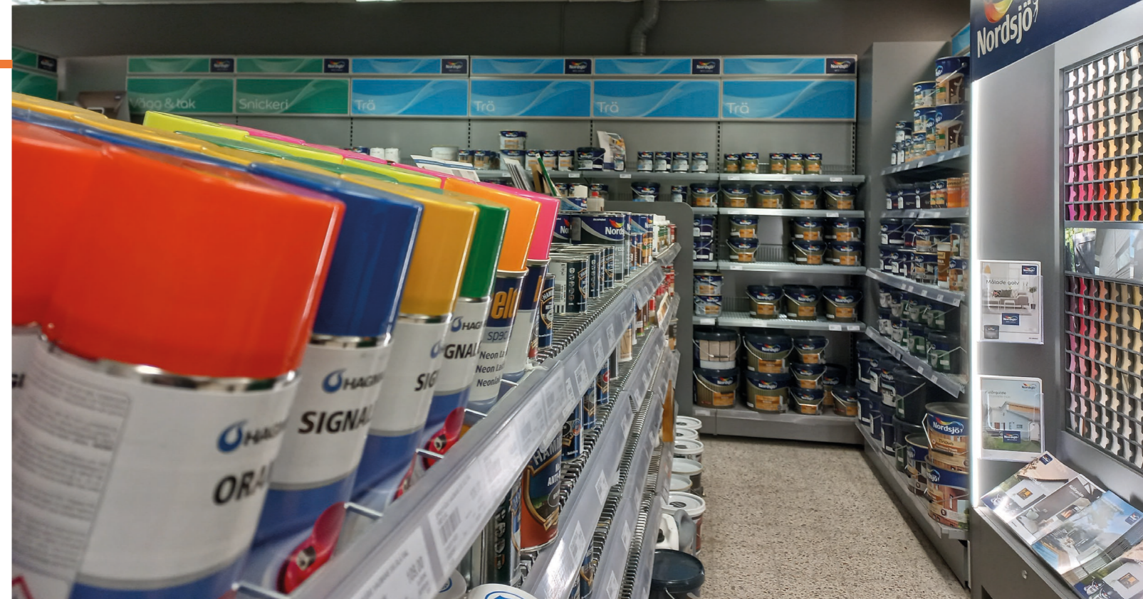
Färgavdelningen med mycket av välja mellan.

-Det är jätteroligt att vi kan sälja utanför kommunen. Sen märker vi ju att det kommer in många kunder från grannkommunerna. Sönt är jätteroligt. Att vi kan ta in