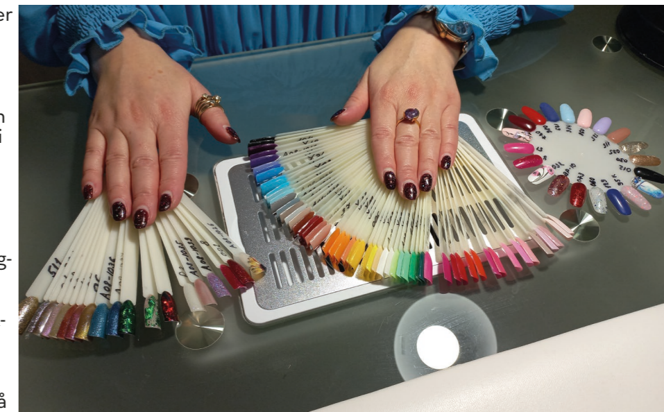
Urvalet av färger och stilar är stort.