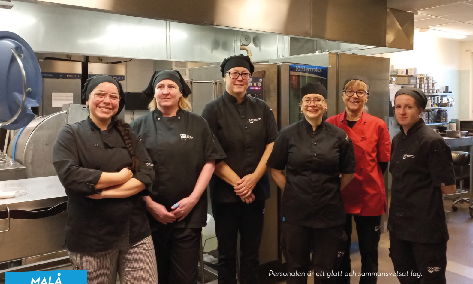
Personalen är ett glatt och sammansvetsat lag.