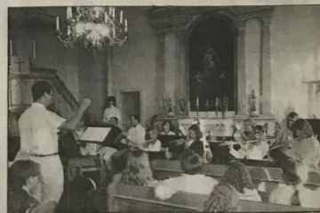
★ Den stillsammare delen hölls i Malå kyrka där Malå blåsare spelade inför fulltalig publik