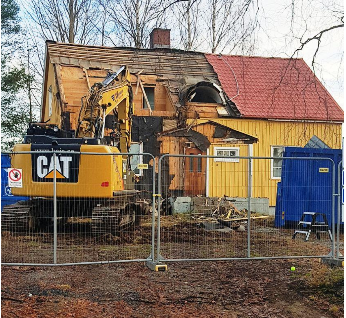
När Gula villan hade gjort sitt revs huset.