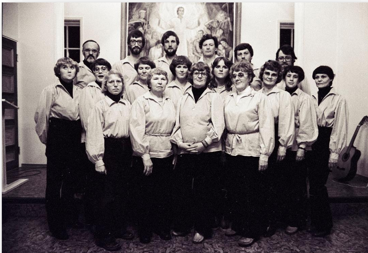
Kören Ättestruparné framträdde vid en stor musikkväll i Malå i november 1979. Medverkade gjorde också flera ungdomar.