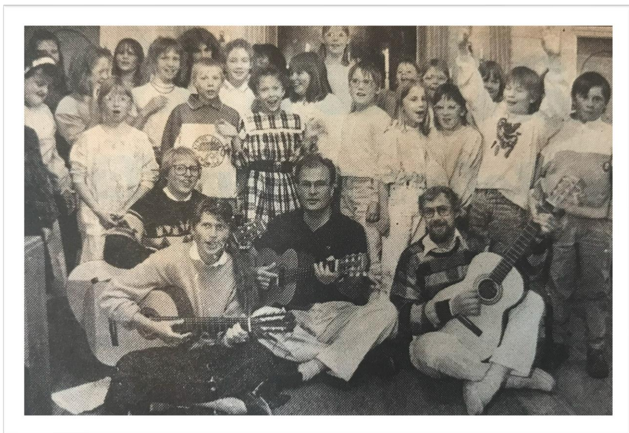
Vårkonserten 1988. Nu med fyra musiklärare.