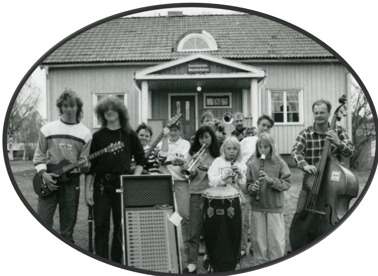
Gula villan.

Musikskolan flyttade till "Gula villan", ett hus mellan skolan och busstationen. Här huserade verksamheten i två våningar under många år framöver.