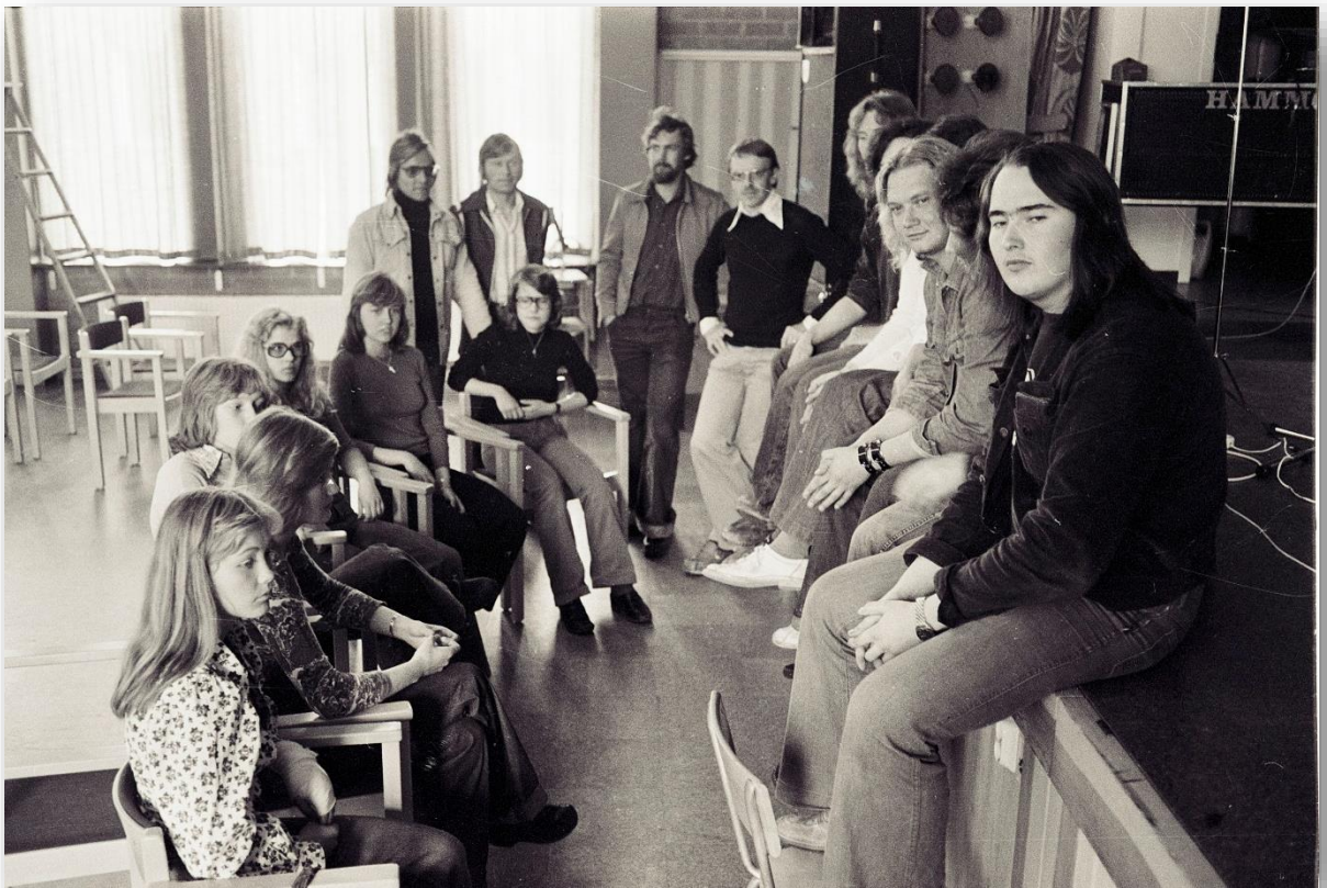
Musikdebatt i skolans aula våren 1975.

”För högt!” menade både lärare och elever, men applåderna var också höga och starka och så småningom skulle Tone Craft (senare ombildat till Rebecca) få flera efterföljare, mer eller mindre kopplade till musikskolan. Band som Bronx, Pererix, Boogarts och många fler.