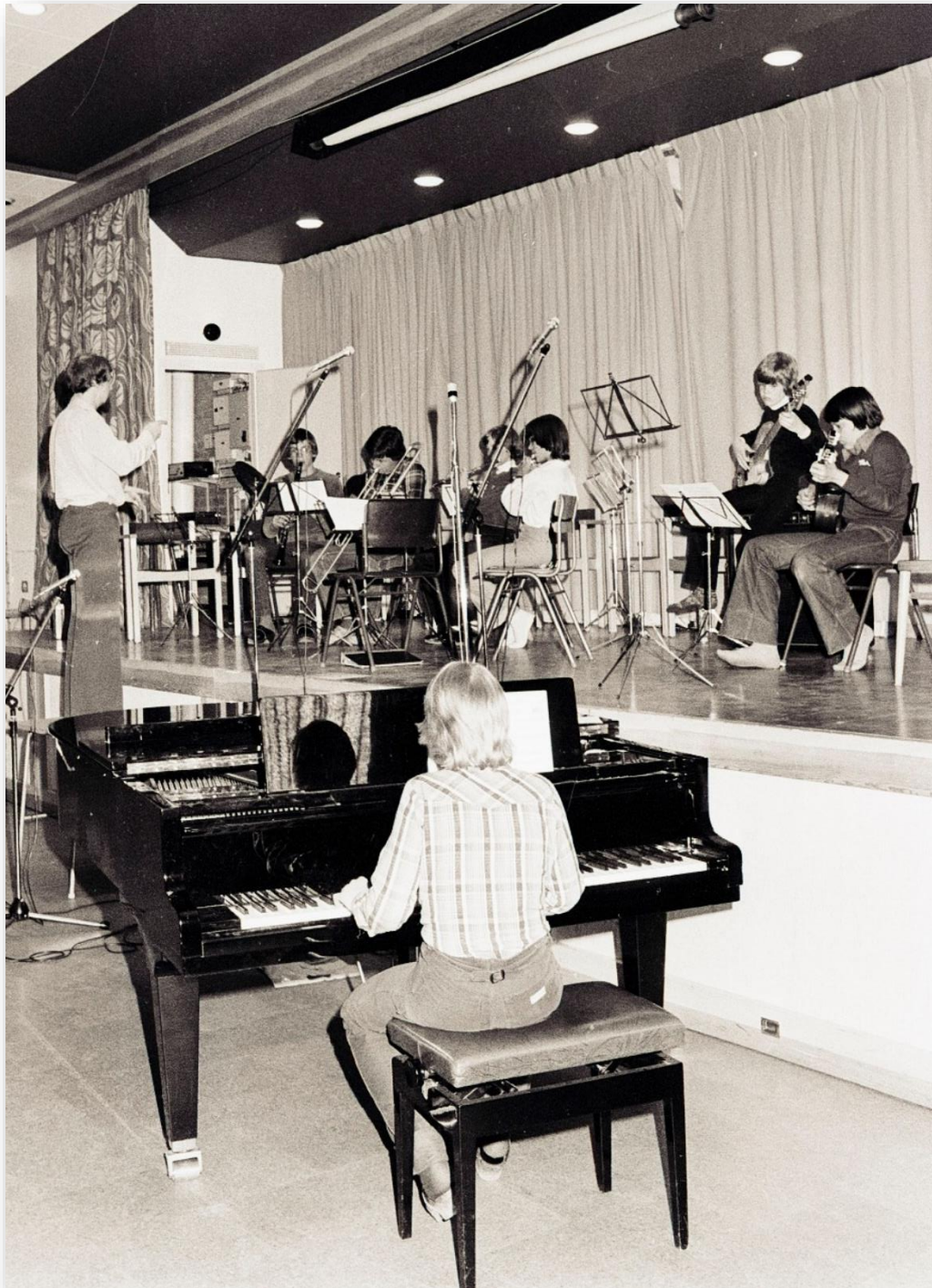
Musikskolans vårkonsert 1978.

det med åren vuxit rejält och ibland har lokalen varit så fullsatt att inte all publik fått plats.