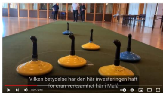
Uppföljning bygdemedel Malåborg Handikappföreningen