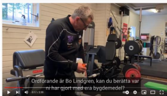
Uppföljning bygdemedel Gurans Gym

Bygdemedel är pengar som kan sökas i bygder som påverkats av utbyggnaden av vattenkraft. Pengarna ska i första hand gå till reparationer av skador som uppkommit på grund av vattenregleringen. Utöver detta går det även att söka bygdemedel för investeringar som är till allmän nytta i bygden.