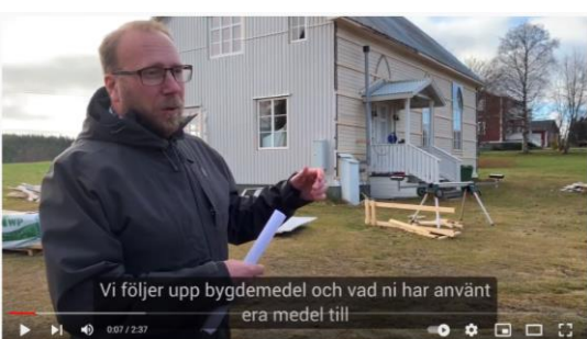
Uppföljning bygdemedel Svedjan byaförening

Fastställd av kommunstyrelsens ordförande 2023-04-24