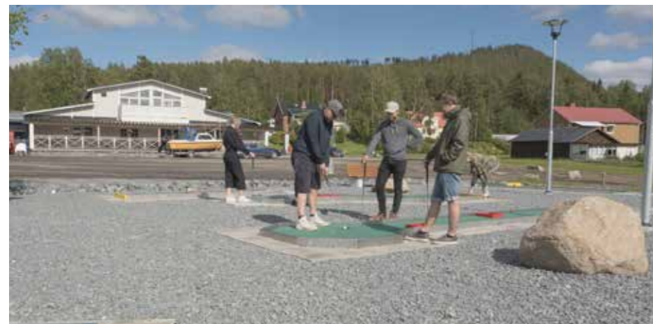
Nio banor väntar de som vill prova på den nya bangolfen. I bakgrunden uteserveringen.

– Det är roligt att se människor med idéer och entusiasm genomföra konkreta satsningar som gör ett samhälle som Malå ännu trevligare.