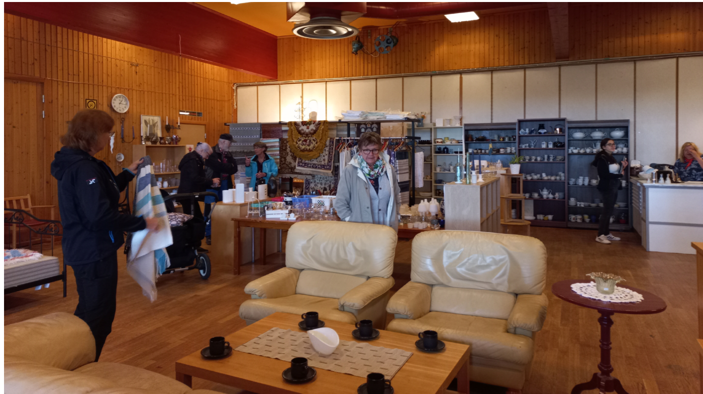
Glada kunder på nya Galejan på Malåborg.