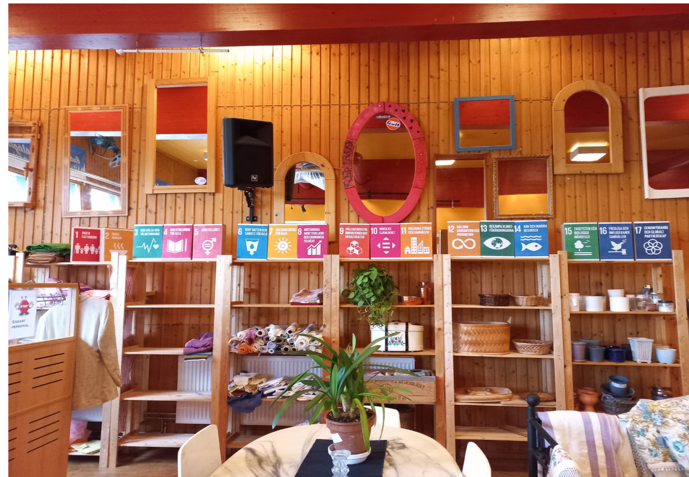
De globala målen utställda på Galejan.

- Jag vill uppmärksamma att det finns en praktiksamordnare i Malå kommun. Även privata näringslivet kan höra av sig om de har behov