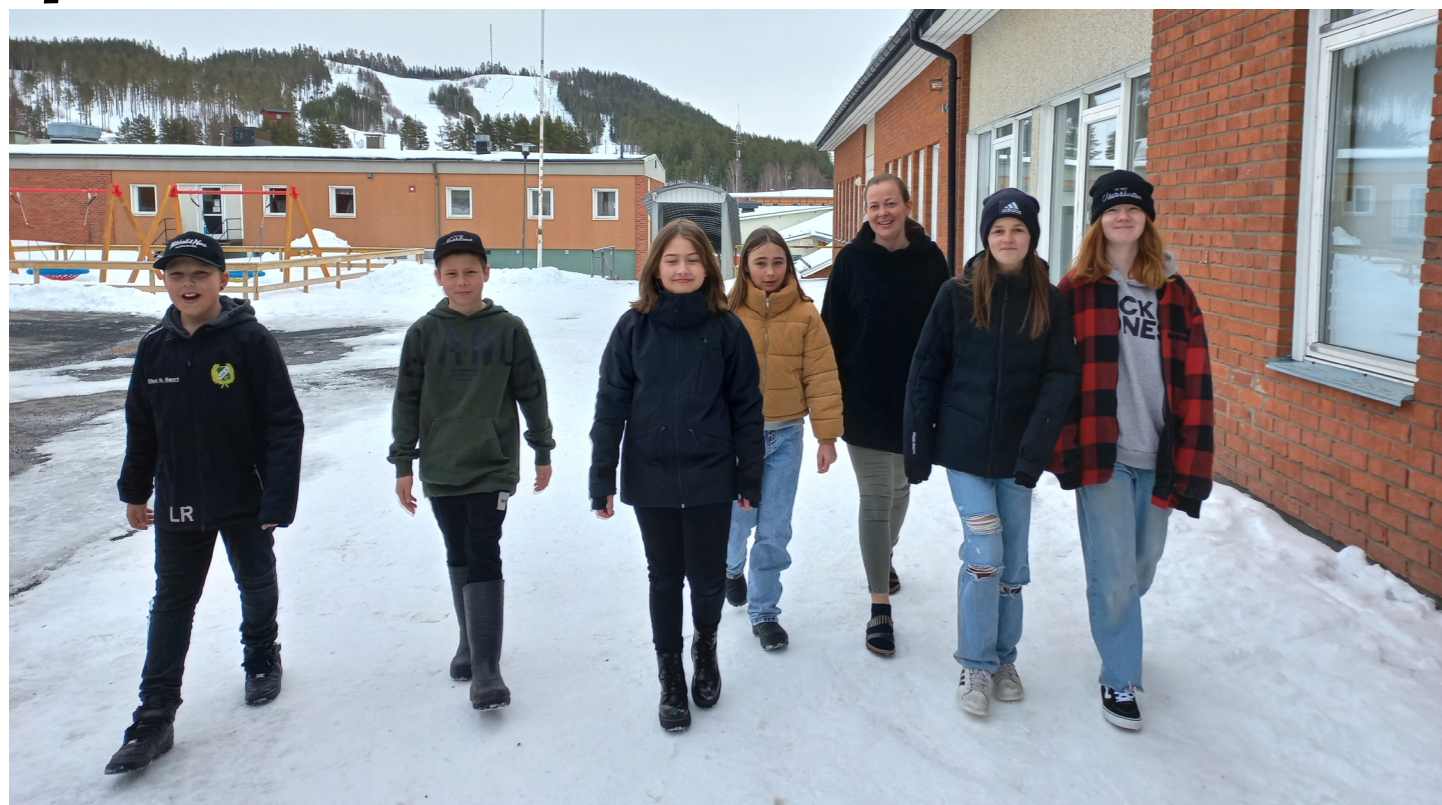
Några elever ur årskurs 5 som fått företagsamhet på skolschemat.

I Nilaskolan hör man hur kugghjulen i elevernas huvuden är i full rörelse. Det tas fram prototyper på lösningar för vardagsproblem och görs planer på hur framtida bensinmackar kanske borde se ut. Eleverna berättar ivrigt om deras produkter som de tävlade med inför jury på Här finns jobben- mässan. Tandborstar med inbyggd tandkräms-portionerare för att få just rätt mängd tandkräm och frukostbrickor med kyl- och värmeeffekt för att alltid hålla frukosten vid rätt temperatur är bara några av de otroliga idéerna eleverna berättar om.